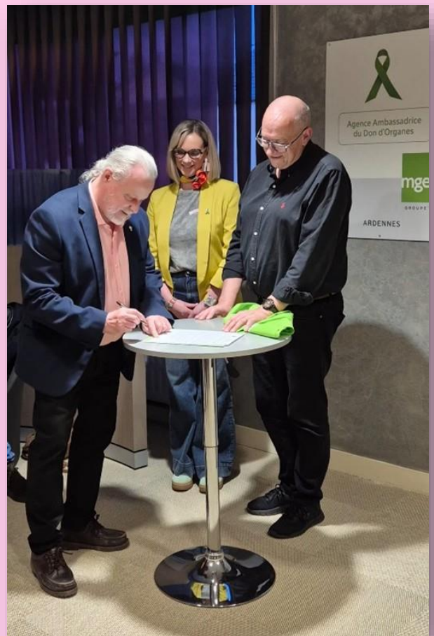
La signature de la charte d'agence ambassadrice du don d'organes