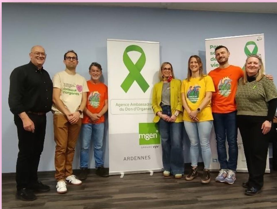
Une photo souvenir de l'inauguration avec les représentants de la coordination du don d'organes du Centre Hospitalier Intercommunal Nord-Ardenne