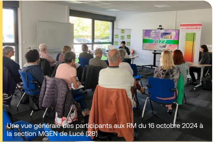
Une vue générale des participants aux RM du 16 octobre 2024 à la section MGEN de Lucé (28)

Notons que celui-ci s'est tenu le même mois (mars 2023) que la création de la MdF de Dreux et que l'entrée en fonction de Mathilde Haulon en Eure-et-Loir. Ces Rencontres mutuelles 2024 ont donc renforcé cette convergence entre ces trois entités et souhaitons que les synergies demeurent fécondes à l'avenir.