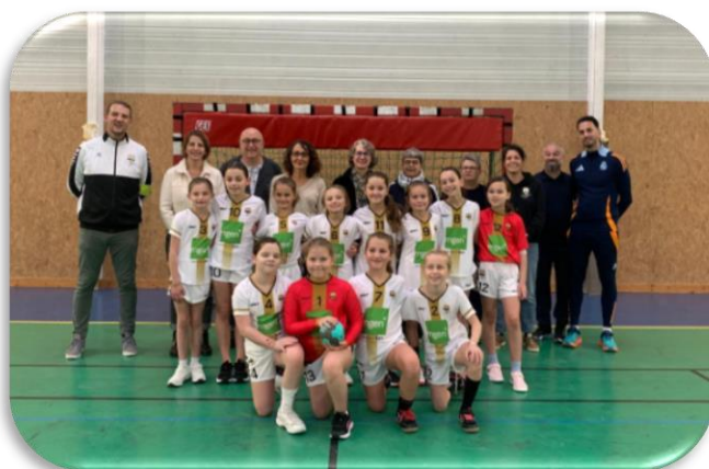
La remise des maillots aux handballeuses de l'ASPTT Bar-le-Duc Meuse Grand Sud par les élus du comité départemental MGEN de la Meuse