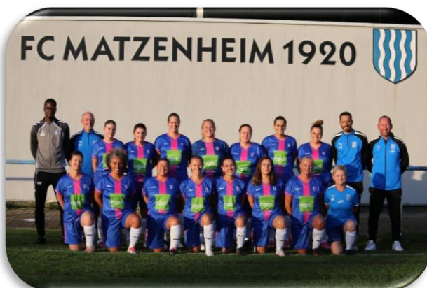
Les footballeuses alsaciennes du FC Matzenheim

Très concrètement cela commence par lutter contre le décrochage sportif des jeunes filles. À travers un appel à projets pour soutenir la pratique sportive féminine, MGEN soutient 40 clubs partout en France en basketball, football et handball en fournissant une tenue complète aux joueuses. Dans le Grand Est, nous sommes ravis d'avoir pu accompagner trois clubs de championnes : le FC Matzenheim dans le Bas-Rhin, l'US Silvange Basket en Moselle et l'ASPTT Bar-le-Duc Meuse Grand Sud Handball.