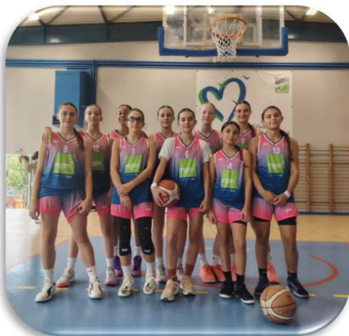
Les basketteuses de l'US Silvange Basket prêtes pour le match