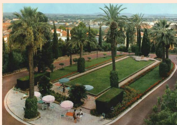
Jardin d'honneur et panorama