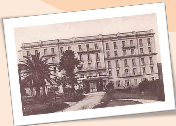
Châteaubriand dit « Britannique Hôtel »

L'hôtel Chateaubriand, également connu sous le nom « Châteaubriand, hôtel des voyageurs » et « Chateaubriand, Britannique hôtel » a été construit à la fin des années 1880 (lors du lotissement du domaine de Gaspard Van Bredenbeck de Châteaubriand, sur l'emplacement de sa villa détruite). C'est le dernier des grands hôtels construits à Hyères. Il a attiré une importante clientèle anglaise à qui il proposait 90 chambres et de luxueuses prestations (ascenseur, chauffage central dans toutes les chambres, court de tennis, etc.) Réquisitionné pendant la guerre, il n'a pas trop souffert. C'est le seul des grands hôtels d'Hyères qui ait conservé ses décors intérieurs néo-Louis XVI dans le salon et la salle à manger.