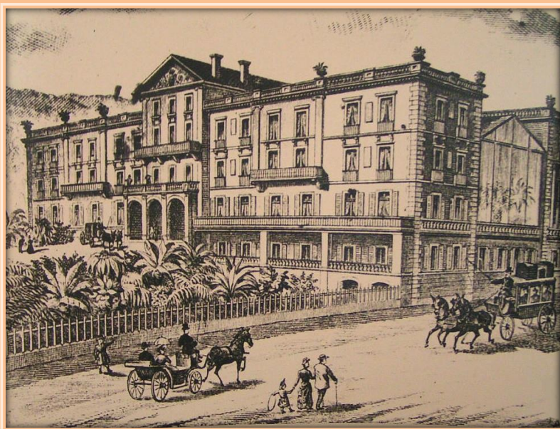
Projet pour l'hôtel Chateaubriand (gravure de la fin du XIX° Siècle)

Anecdote → Dans les années 1890, les Britanniques représentent l'essentiel de la clientèle des hôtels au point que toute la ville s'est mise à « l'heure anglaise »