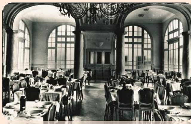
Salle à manger -1951