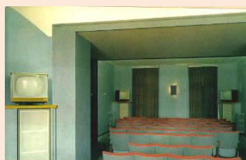
Salle de télévision