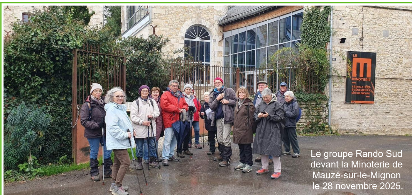
Le groupe Rando Sud devant la Minoterie de Mauzé-sur-le-Mignon le 28 novembre 2025.

tél : 06 76 21 30 20 Courriel : catherine_michel@outlook.fr