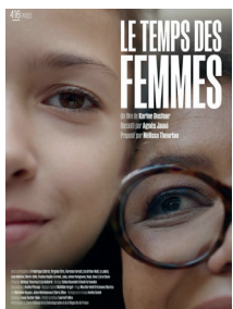
Le Temps des femmes de Karine Dusfour, (97 mn)

Le temps des femmes est-il venu ? Leur vie au quotidien a-t-elle vraiment changé depuis les soixante dernières années ? Accompagnée de femmes anonymes ou célèbres, Agnès Jaoui raconte cette nouvelle temporalité de l'intime et d'une récente histoire en marche. De milieux et d'âges très différents, elles se livrent ici avec toute l'énergie vitale, la force et l'humour qui les réunit. De la cour de récré à l'âge de la retraite, le documentaire retrace leurs vécus communs, faits de préjugés et de stéréotypes, mais traversés aussi d'espoir et de fierté. A partir d'archives personnelles inédites ou historiques marquantes jusqu'aux vidéos récentes issues des réseaux sociaux, ce film donne aux femmes le premier rôle et leur permet de redevenir sujet de leur propre histoire. Bienvenue dans le temps des femmes.