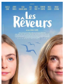
Les Réveurs de Isabelle Carré, (106 mn)

Élisabeth, comédienne, anime des ateliers d'écriture à l'hôpital Necker avec des adolescents en grande détresse psychologique. À leur contact, elle replonge dans sa propre histoire : son internement à 14 ans. Peu à peu, les souvenirs refont surface. Et avec eux, la découverte du théâtre, qui un jour l'a sauvée.