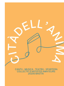
Cantid'ella Citadell'anima, (30 mn)

Dans une société qui semble désirer une place plus équitable pour les femmes, Filles du Calvaire, dans un enchaînement de disciplines artistiques, une mise en scène chorégraphiée, n'impose pas mais bouscule et emmène cette idée : et si nous commençons par mieux protéger, par plus informer.